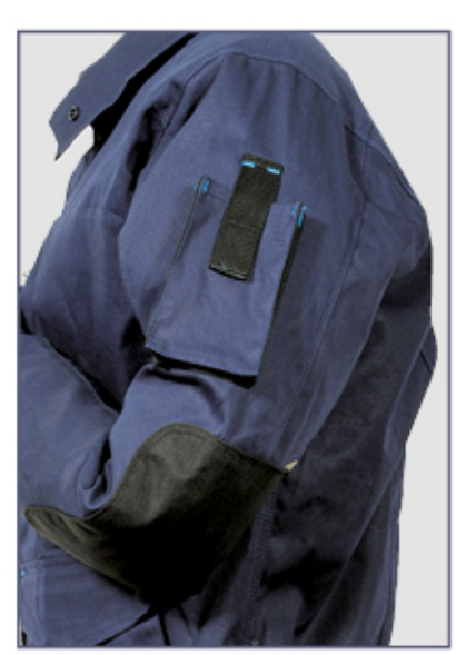
toppe antiabrasione su maniche

Tested for harmful substances, www.oeko-tex.com/standard100