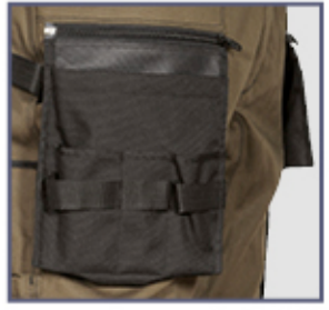
tasca esterna porta chiodi in nylon

2 ampie tasche anteriori, cavallo rinforzato, D-Ring, doppia tasca posteriore con velcro, elastico interno in vita , inserti reflex 3M™ Scotchlite™ Reflective Material - 8725 Silver Fabric, passante portamartello, taglio ergonomico di gambe e giňocchia, tasca laterale, tasca porta monete, tasca portametro, tasche esterne porta chiodi in nylon, staccabili tramite zip, tasche per ginocchiere in nylon con posizione regolabile, tessuto elasticizzato