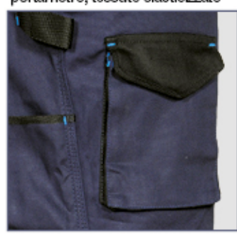
tasca frontale portaoggetti

2 ampie tasche anteriori, cavallo rinforzato, D-Ring, doppia tasca posteriore con velcro, elastico interno in vita, inserti reflex 3M™ Scotchlite™ Reflective Material - 8725 Silver Fabric, passante portamartello, taglio ergonomico di gambe e ginocchia, tašca frontale portaoggetti, tasca laterale, tasca porta monete, tasca portametro, tessuto elasticizzato