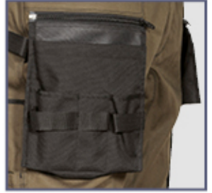
tasca esterna porta chiodi in nylon

2 ampie tasche anteriori, cavallo rinforzato, D-Ring, doppia tasca posteriore con velcro, elastico interno in vita, inserti reflex 3M™ Scotchlite™ Reflective Material - 8725 Silver Fabric, passante portamartello, taglio ergonomico di gambe e ginocchia, tasca laterale, tasca porta monete, tasca portametro, tasche esterne porta chiodi in nylon, staccabili tramite zip, tasche per ginocchiere in nylon con posizione regolabile, tessuto elasticizzato