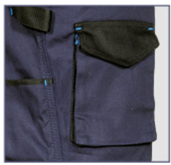
tasca frontale portaoggetti

2 ampie tasche anteriori, cavallo rinforzato, D-Ring, doppia tasca posteriore con velcro, elastico interno in vita , inserti reflex 3M™ Scotchlite™ Reflective Material - 8725 Silver Fabric, passante portamartello, taglio ergonomico di gambe e ginocchia, tasca frontale portaoggetti, tasca laterale, tasca porta monete, tasca portametro, tessuto elasticizzato