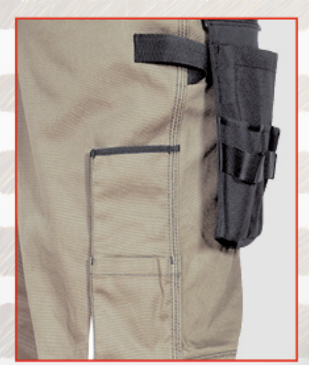
tasca portametro, passante portamartello