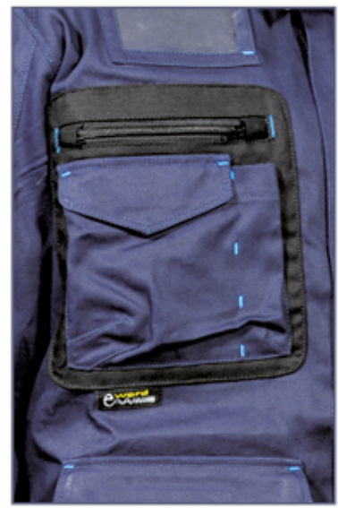
tasca porta cellulare con tessuto E-WARD